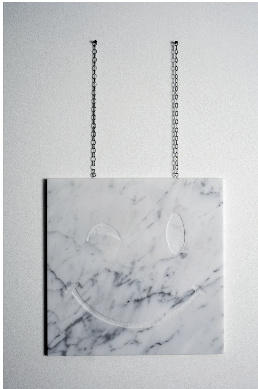
Cestovatelé / Travelers, 2021, objekt / object