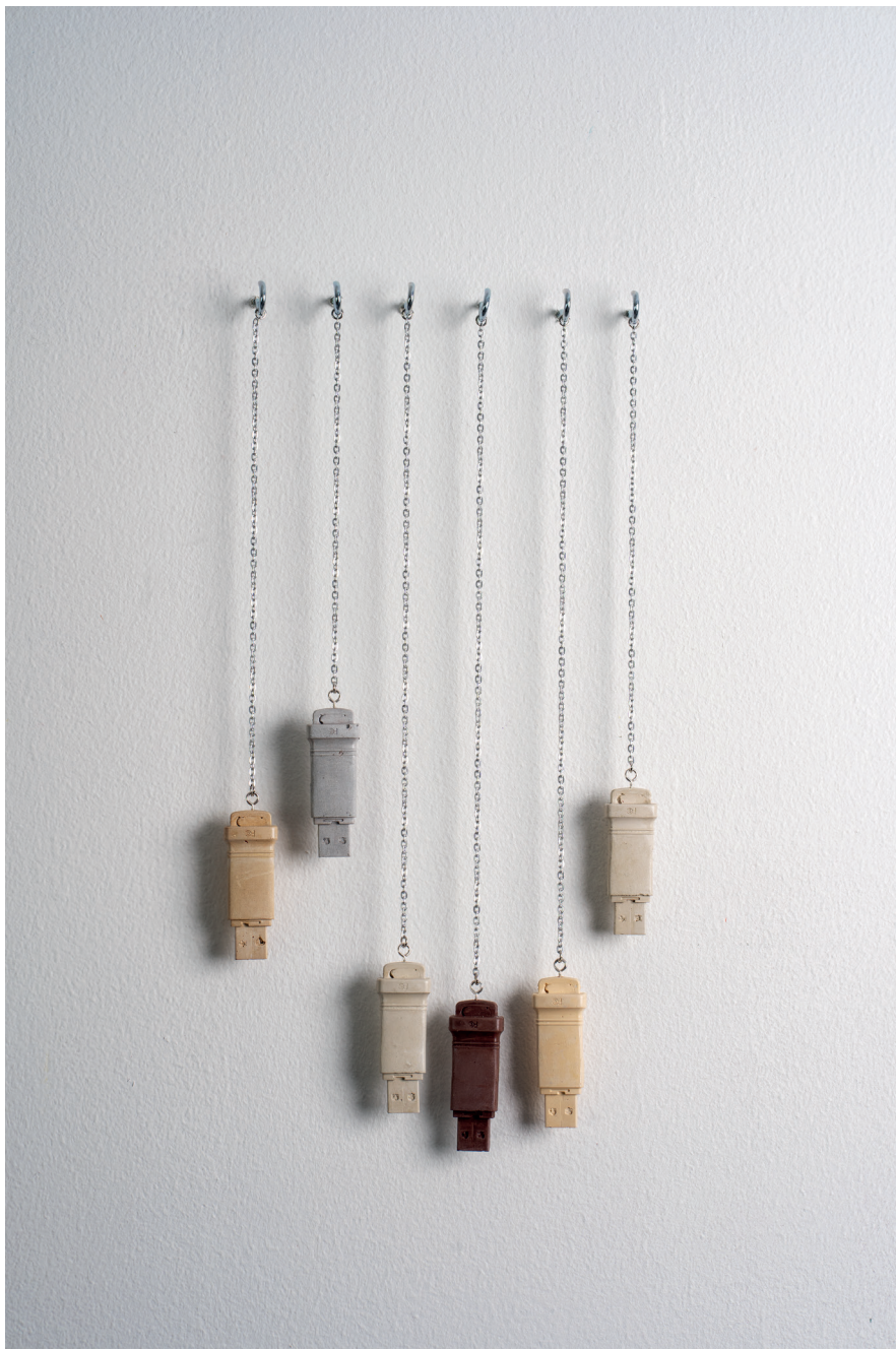
Cestovatelé / Travelers, 2021, objekt / object