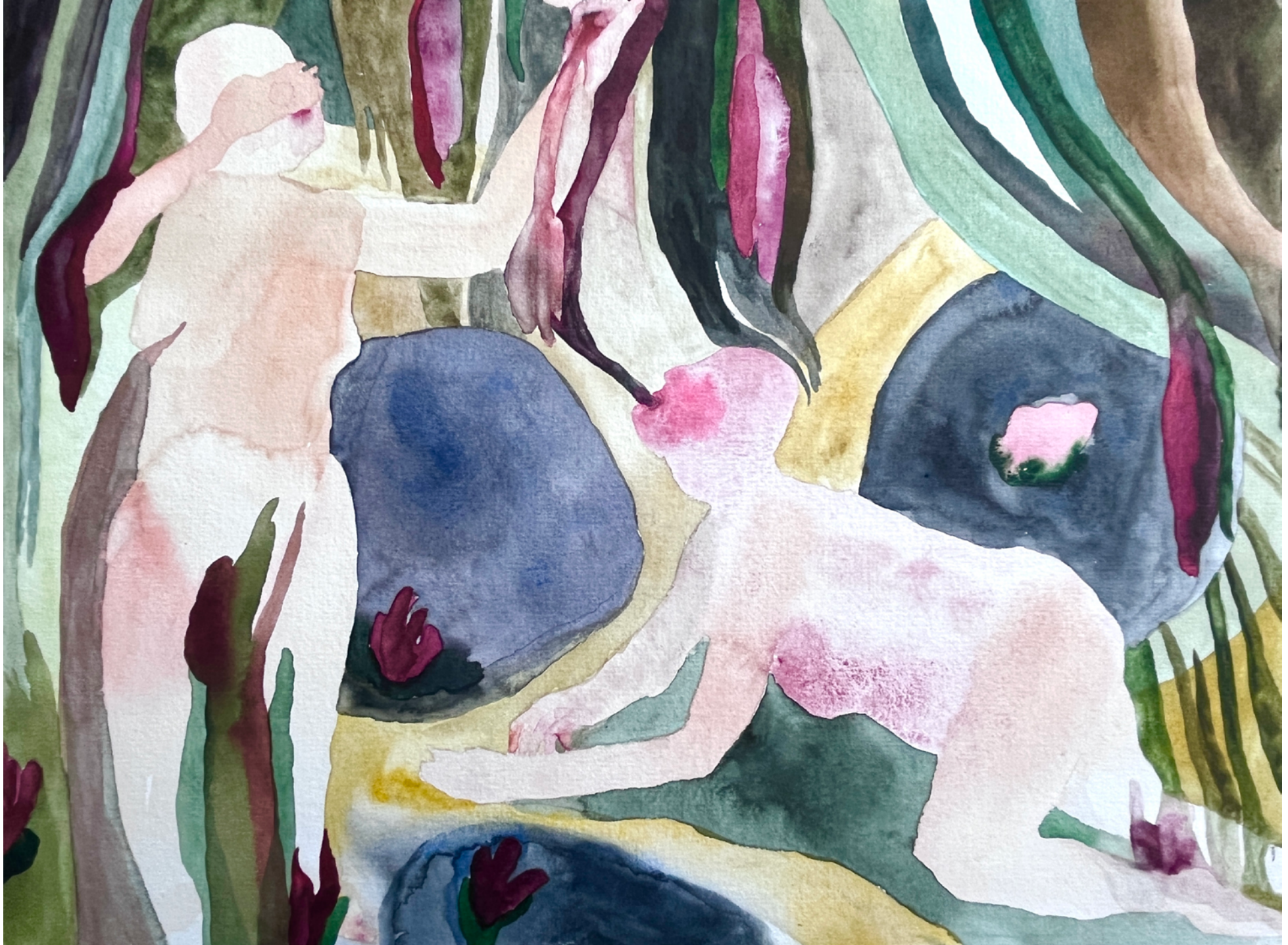
Pijavice, akvarel na papíře, 24 × 32 cm, 2022 The Leech, watercolour on paper, 24 × 32 cm, 2022