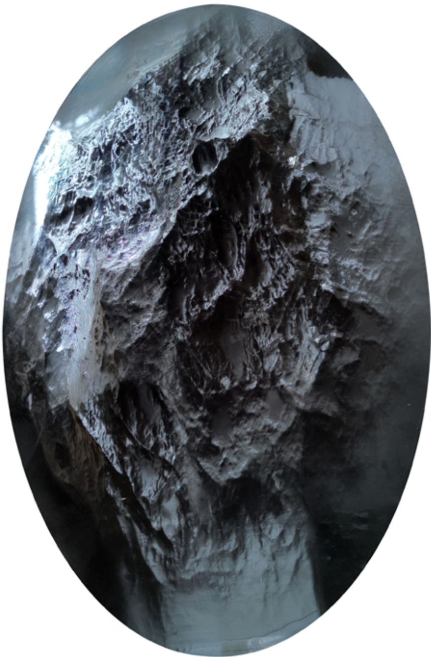
Monos, 2024, objekt, interaktivní zvuková instalace

Monos, 2024, object, interactive sound installation