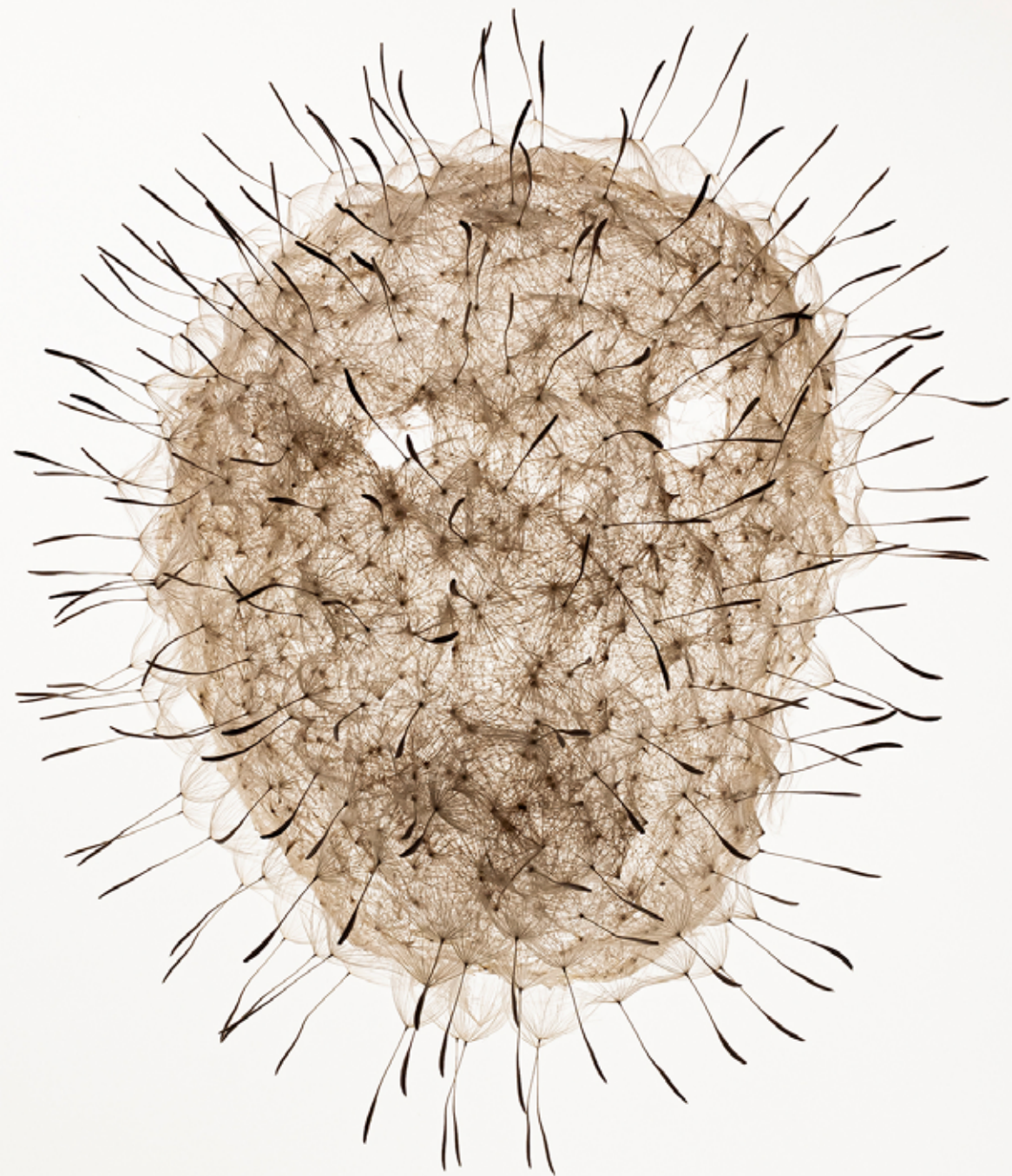
série Tichý poutník, 2024, kombinovaná technika, lepené pampeliškové semínko series Calm Wanderer, 2024, mixed technique, glued dandelion seed