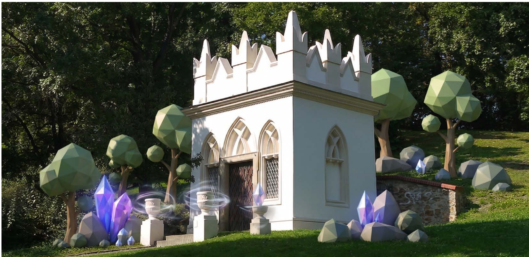
Bias Protocol, 2026, site-specific instalace, XR, vizualizace: Michal Poustka Bias Protocol, 2026, site-specific installation, XR, visualization: Michal Poustka