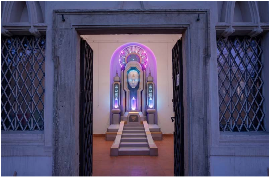
Bias Protocol, 2026, site-specific instalace, XR, vizualizace: Michal Poustka Bias Protocol, 2026, site-specific installation, XR, visualization: Michal Poustka